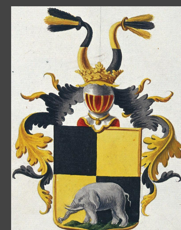
Von Hellfreichi suguvõsa vapp Coat of arms of the von Hellfreich family