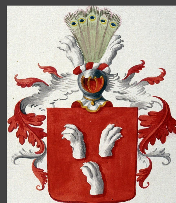
Von Lode suguvõsa vapp Coat of arms of von Lode family