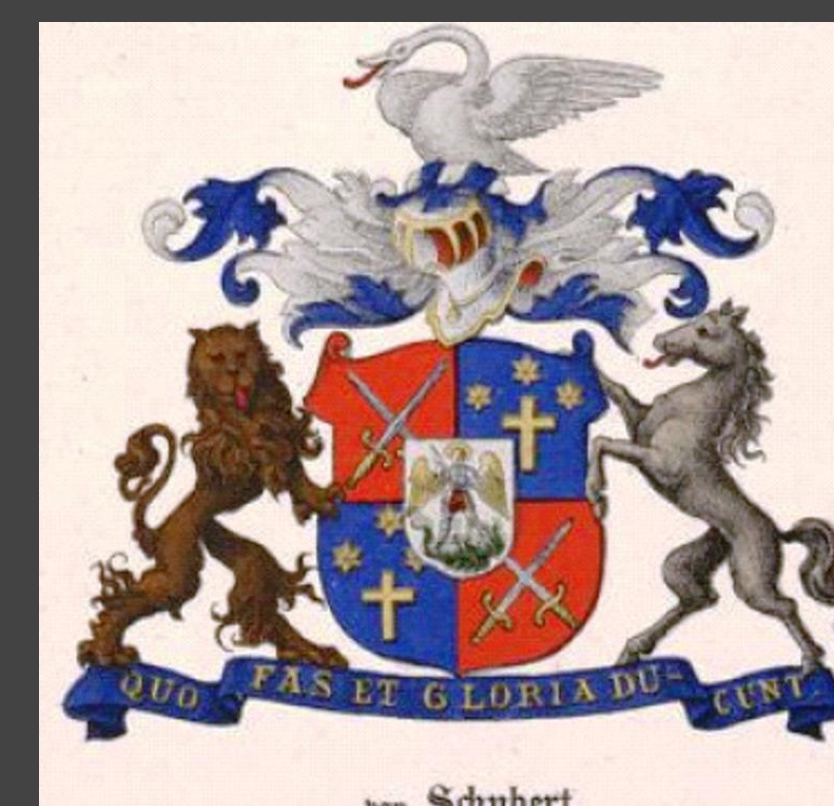
Von Schubertite suguvõsa vapp Coat of arms of the von Schubert family